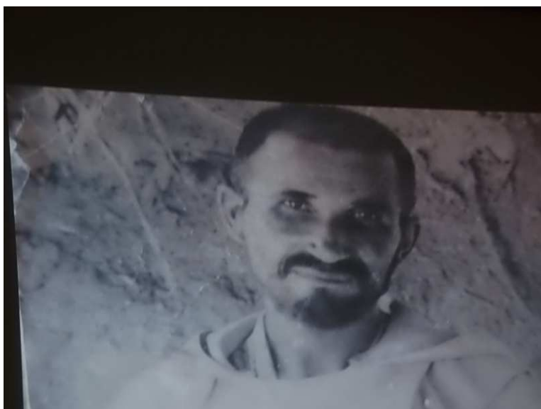
Le père de Foucaud

La soirée, s'est terminée en toute convivialité en continuant les échanges cordiaux.