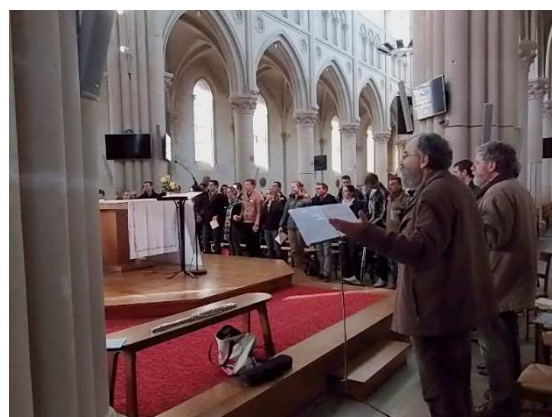
Le Notre Père avec l'assemblée...