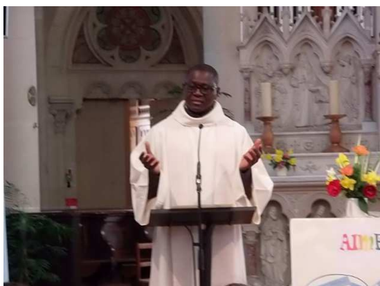
« Aimer, c'est tout donner et se donner soi-même... »